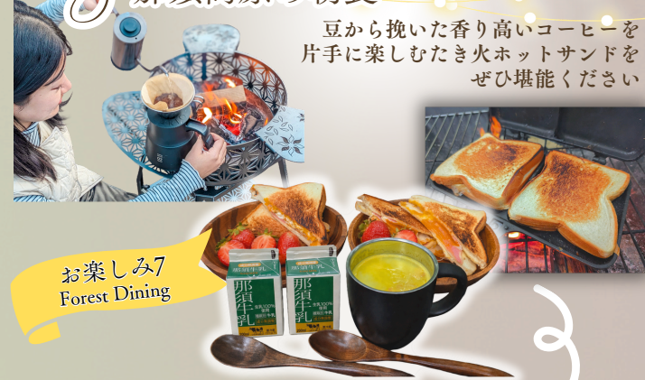
お楽しみ7 Forest Dining

豆から挽いた香り高いコーヒーを 片手に楽しむたき火ホットサンドを ぜひ堪能ください