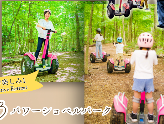
お楽しみ1 Active Retreat