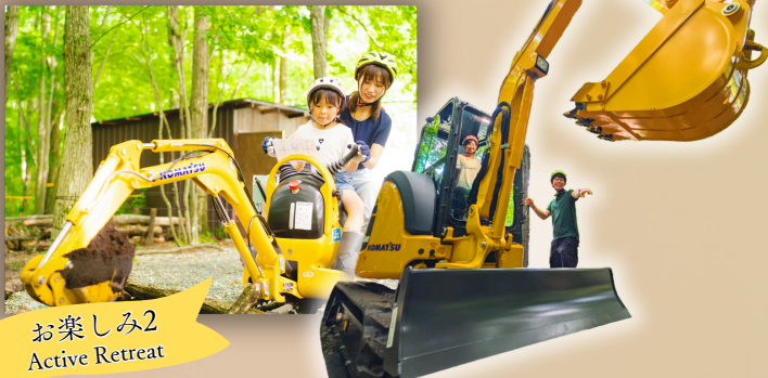
お楽しみ2 Active Retreat

宿泊者は特別価格で体験可能！ 本物のパワーショベルを操作しよう！ 大型と小型の2種類から選択できます！ ※予約状況によりご案内できない場合もあります ※大型は10歳以上限定