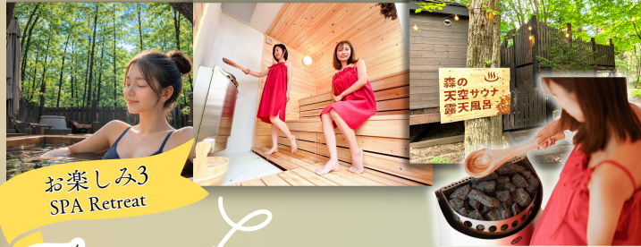
お楽しみ3 SPA Retreat

宿泊者は特別価格で利用可能！ 予約制で完全貸切のサウナ&露天風呂で整っちゃいましょう！ ツリーハウス型だからワクワク感があり、プライベート感もバッチリ 森と一体になる感覚が新しい！