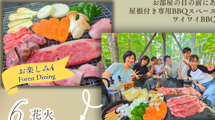
お楽しみ4 Forest Dining

那須高原和牛ステーキと 那須三元豚のバーベキュー お部屋の目の前にある 屋根付き専用BBQスペースで ワイワイBBQ！