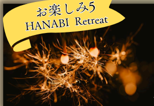
お楽しみ5 HANABI Retreat

リクライニングチェアで星空観察！ 那須高原は空気がきれいなので 満点の星空が！ 流れ星もよく見えます